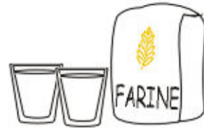
2 verres de farine